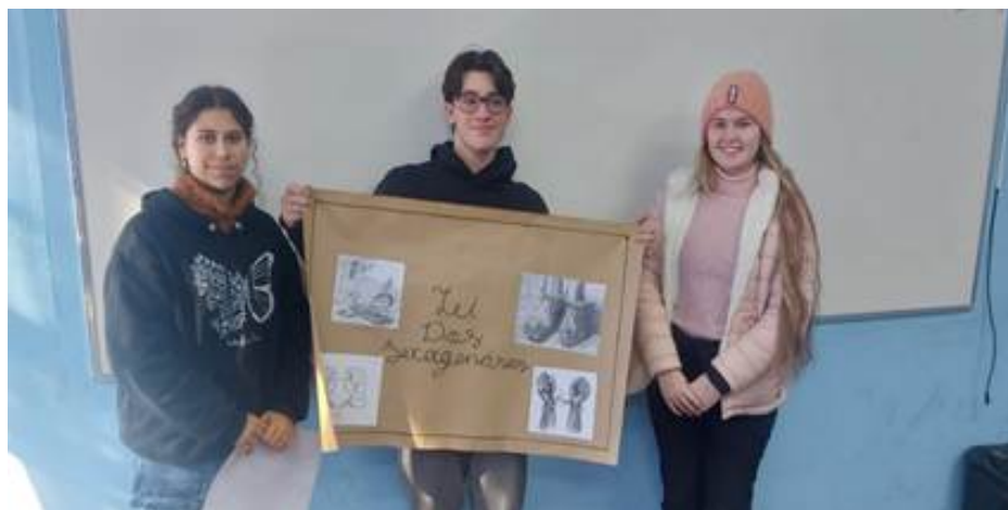
Figura 3. Apresentação de Atividades