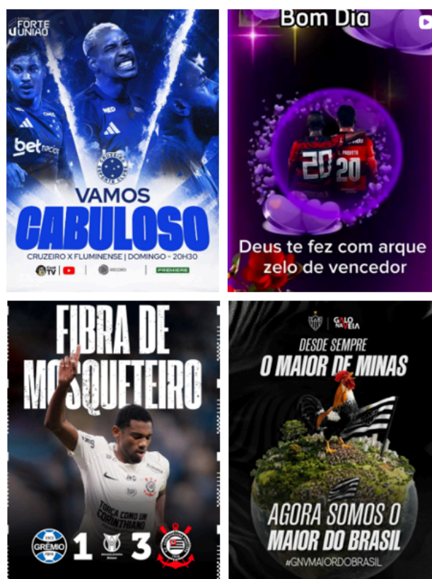
Figura 2. Narrativas de força, vitória e superioridade presentes nas publicações dos clubes analisados