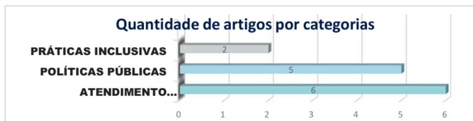
Gráfico 1. Quantidade de artigos por categorias

Em razão dos alunos com AH/SD serem integrantes da Educação Especial, a primeira categoria abrange as políticas públicas voltadas a esta população; a segunda categoria, denominada práticas inclusivas, encontram-se as publicações que descrevem as práticas realizadas, as especificidades deste trabalho; enquanto que na terceira aborda o atendimento educacional dirigido a este público, conforme demonstrado no gráfico 1.