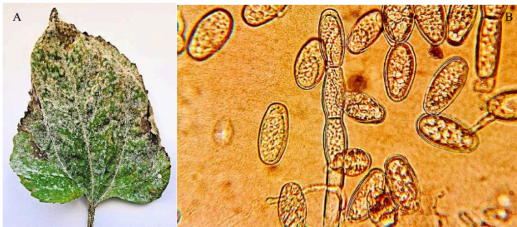
Figura 5 - (A) Girassol ( Helianthus annuus ) com manchas foliares de oídio ( Oidium sp.). (B) Conídios de oídio ( Oidium sp.) vistos no microscópio ótico sob o aumento de (400x).