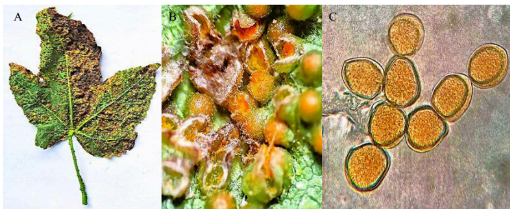
Figura 3 - (A) Face ventral da folha de Lanterna-chinesa ( Callianthe picta ) com pústulas de ferrugem ( Puccinia sp.). (B) Pústulas de ferrugem vistas no estereomicroscópio sob o aumento de (40x). (C) Esporos de ferrugem ( Puccinia sp.) vistos no microscópio ótico sob o aumento de (400x).