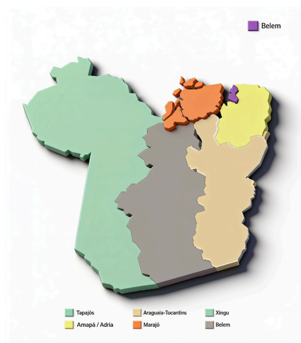
Figura 2 – 6 polos turísticos do Pará atuais

Nos anos 90, a Paratur realizou o mapeamento do turismo no Estado e estabeleceu 4 centros de desenvolvimento setorial (Costa Atlântica, Tapajós, Marajó e Araguaia-Tocantins), antecipando em mais de uma década os fundamentos do Programa de Regionalização do Ministério do Turismo. Na proposta de 2001, houve a separação de um centro e a formação de um novo, resultando nos atuais 6 polos turísticos do Pará, conforme indicado na figura x.