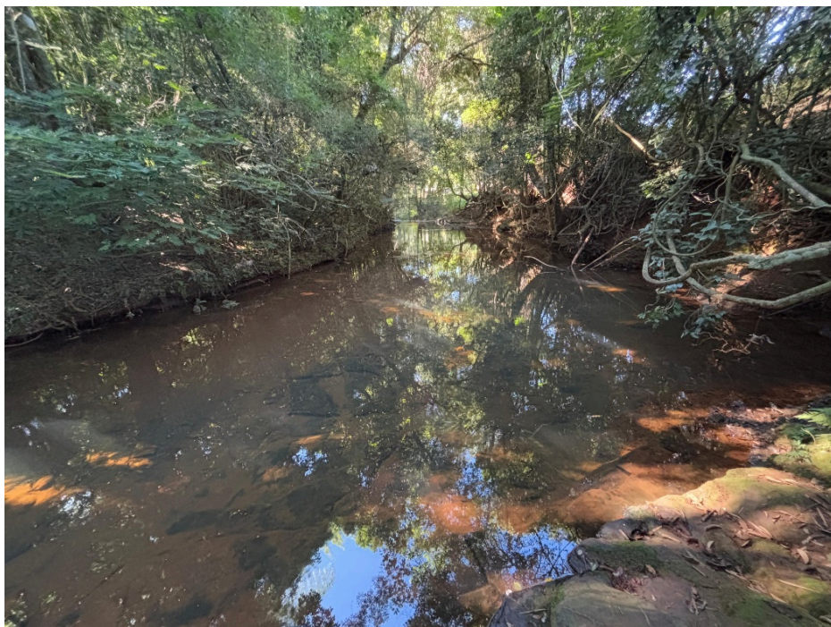
Figura 4 – Preservação do Meio Ambiente