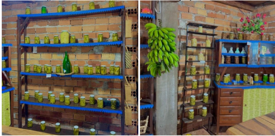
Figura 9 e 10 – Produtos caseiros ofertados na propriedade Grassi.