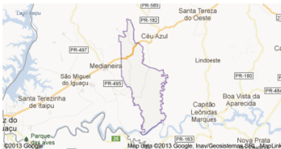
Figura 2 – Localização do Circuito Sabiá na Região Oeste do Paraná