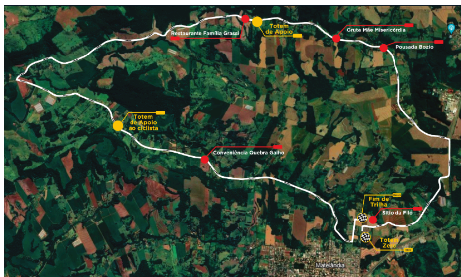
Figura 1 – Mapa do Circuito Sabiá