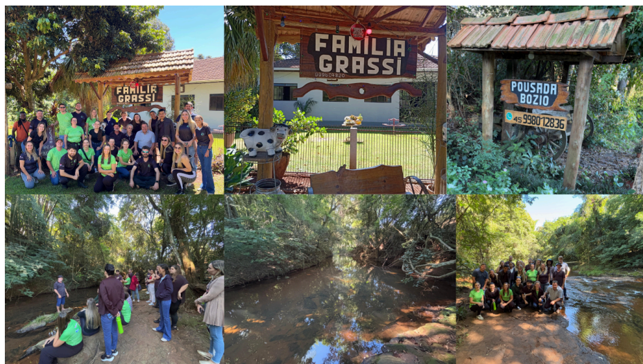
Figura 3 – Família Grassi e Pousada Bozio