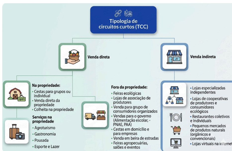
Figura 02: Tipologia de Circuitos Curtos (TCC)