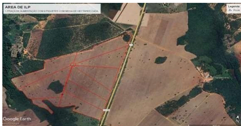
Figura 2 - Delimitação das áreas de vegetação nativa e da área de pastagens na Archer agropecuária.