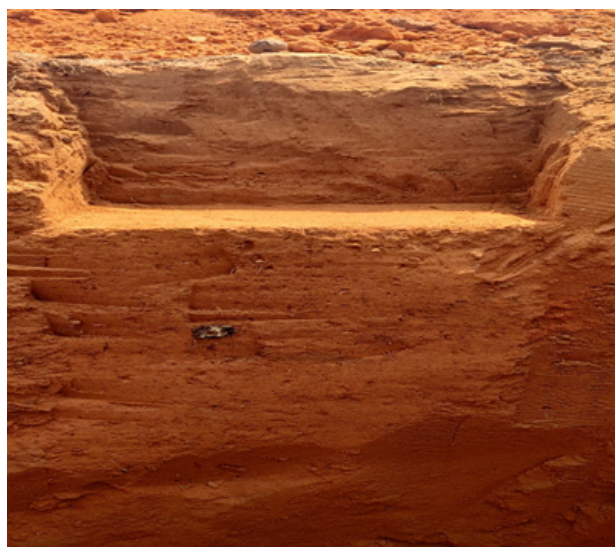
Figura 4 - Perfil do solo coletado na área de Integração Lavoura Pecuária.

Foram coletadas amostras deformadas e indeformadas; as deformadas foram destinadas à avaliação das propriedades químicas do solo, e as indeformadas, à avaliação das propriedades físicas e do estoque de carbono, segundo metodologia descrita pela (Embrapa, 2017). Conforme a figura 04