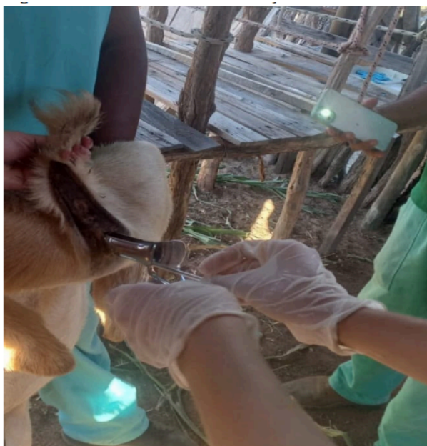
Figura 3. Procedimento de inseminação artificial transcervical realizado nas fêmeas caprinas