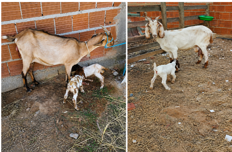
Figura 5. Cabritos nascidos de fêmeas caprinas submetidas ao protocolo de sincronização do estro e inseminação artificial transcervical.

A raça Boer é reconhecida mundialmente por sua elevada aptidão para produção de carne, destacando-se pelo rápido crescimento, precocidade, boa conformação de carcaça e elevados índices produtivos, sendo amplamente utilizada em programas de melhoramento genético (Silva, 2025).