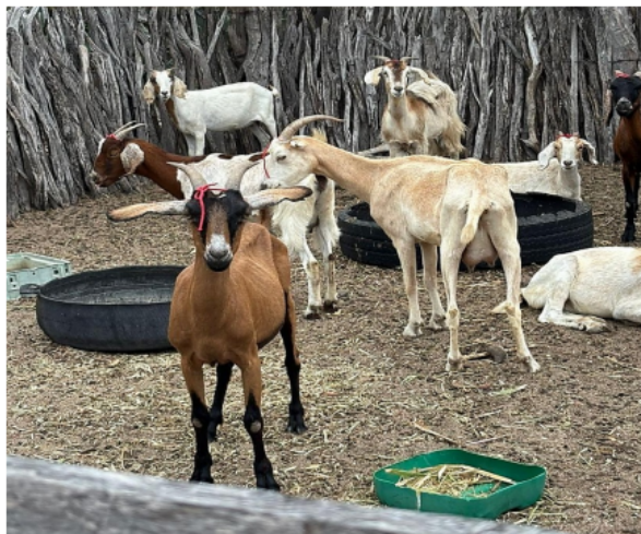
Figura 2. Lote de fêmeas caprinas submetidas ao protocolo de sincronização do estro e inseminação artificial transcervical.