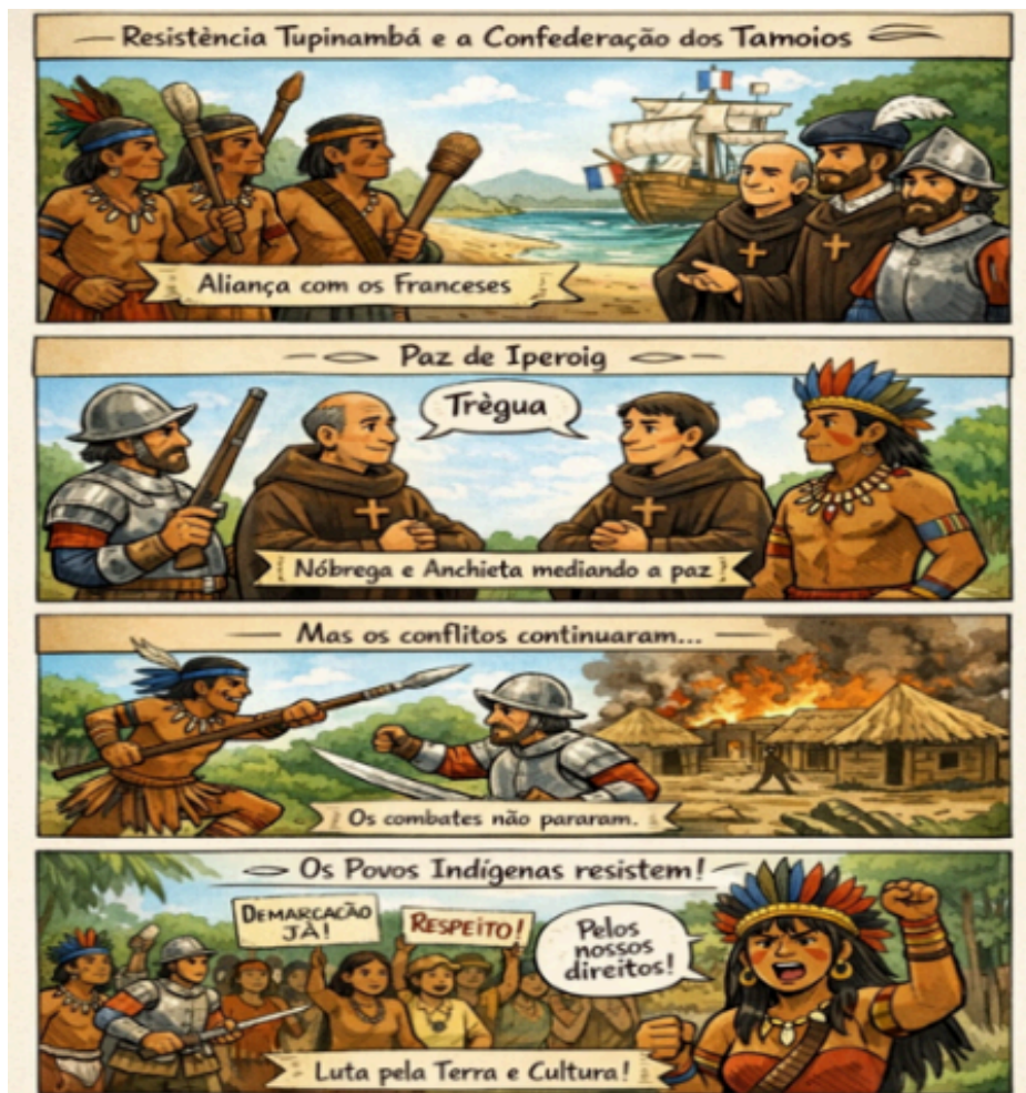
Figura 2 – Confederação dos Tamoios (1554 - 1567).

Fonte: elaborado pelo autor, com uso do Chatgpt, 2026.