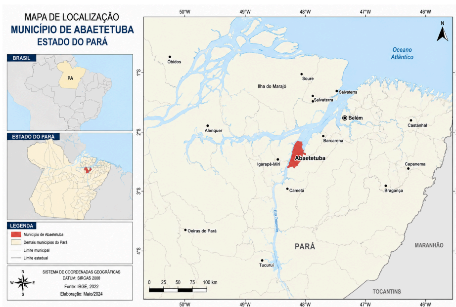
Figura 1: Mapa de Localização Município de Abaetetuba, Pará

O lócus da investigação corresponde às escolas quilombolas situadas no município de Abaetetuba, no estado do Pará. A escolha desse contexto decorre da relevância social, cultural e educacional das comunidades quilombolas no município, bem como dos desafios relacionados à construção de currículos contextualizados, à adequação dos materiais didáticos e à valorização da história, da memória, da cultura e dos saberes tradicionais (Carvalho Junior; Gonçalves, 2026; Carvalho Junior et. al., 2026).