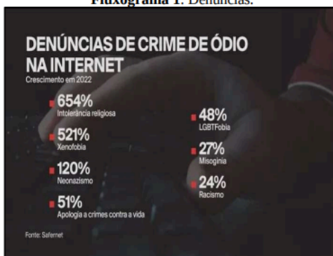
Fluxograma 1: Denúncias.