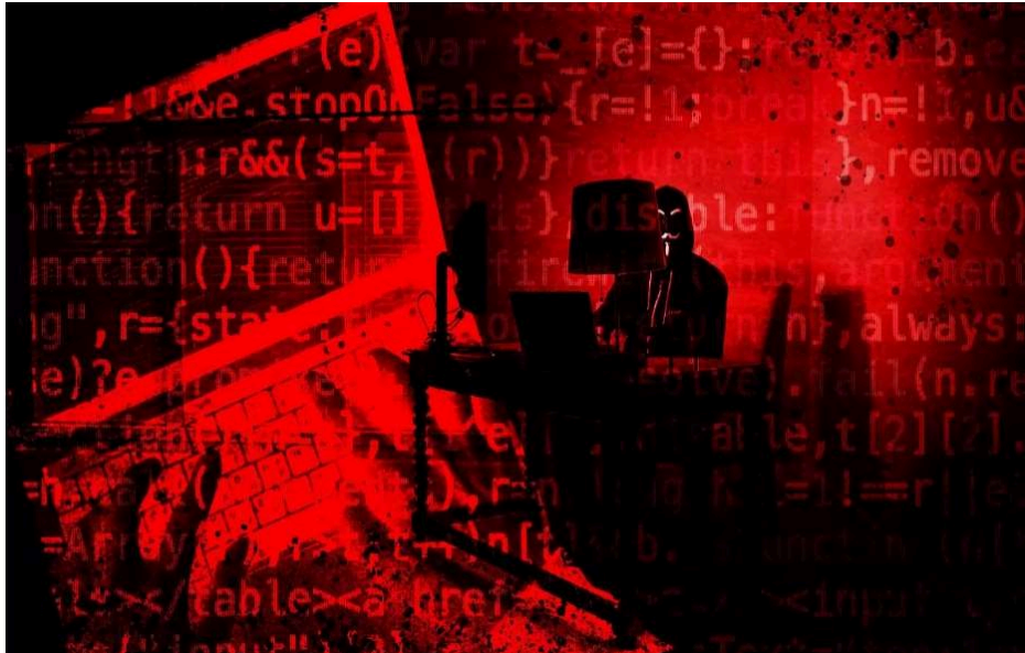
Imagem 2: Discurso de ódio (b).