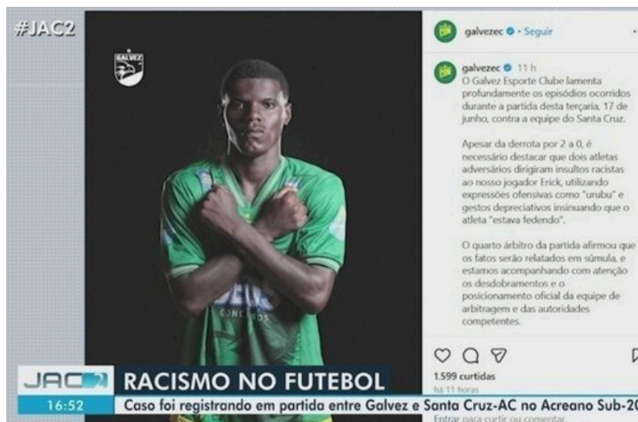
Figura 7: Caso de Racismo no Acre 11