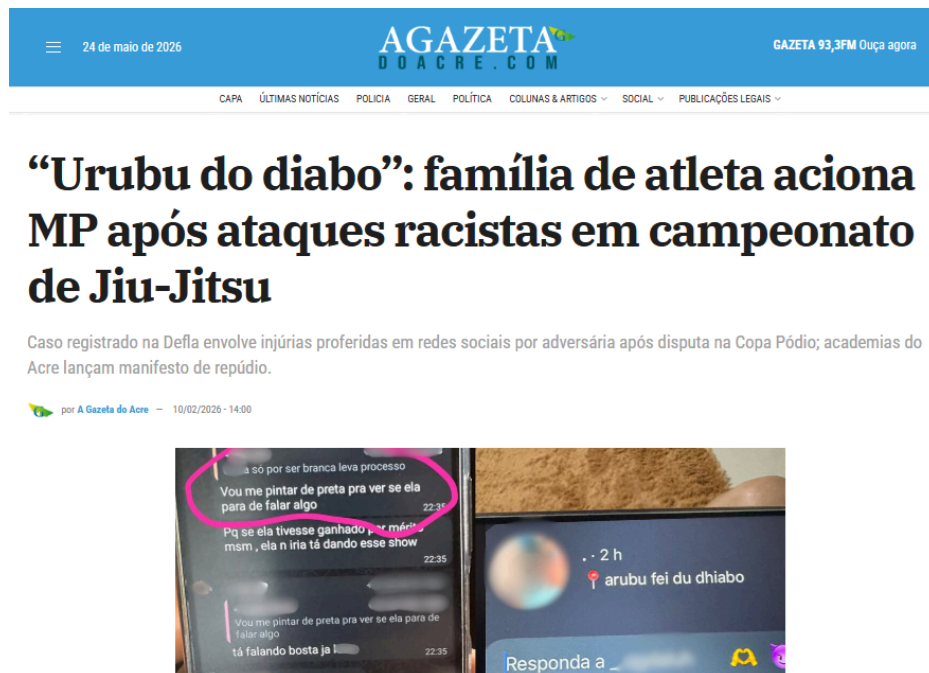
Figura 17: Injúria Racial no Acre 21