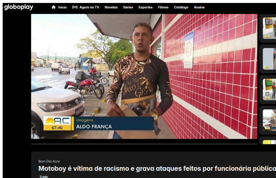
Figura 9: Racismo ocorrente no Acre 13