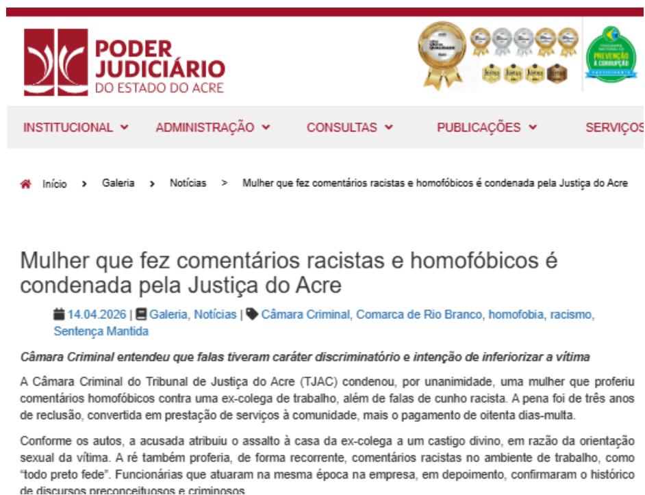
Figura 8: Racismo a trabalhador no Acre 12