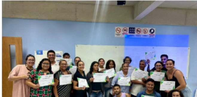
Figura 24: Reparação a racismo escolar no Acre 28

A Secretaria de Assistência Social e Direitos Humanos (SEASDH) lidera essas iniciativas com políticas públicas e atividades para promover a igualdade racial.