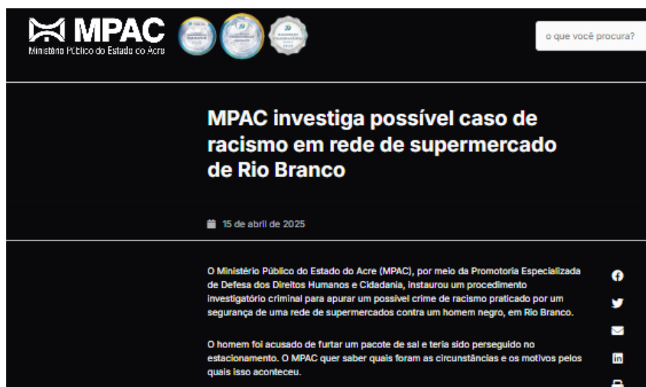
Figura 13: Racismo a jovem no Acre 17