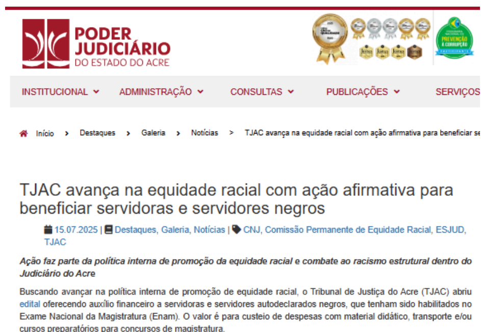
Figura 21: Políticas raciais no Acre 25