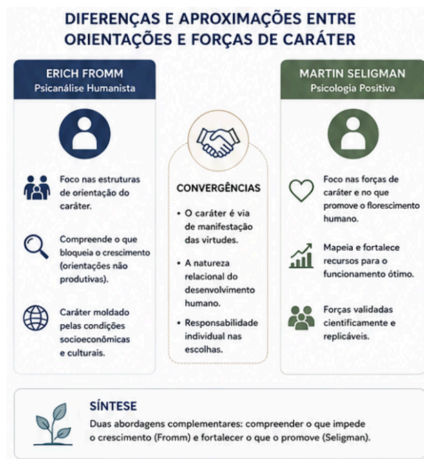
Figura 1: Síntese comparativa entre orientações de caráter e forças de caráter.