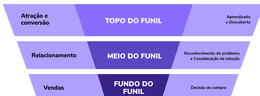
Figura 1: Funil de vendas

O funil de vendas digital é um modelo que mapeia a progressão do prospect desde o primeiro contato até a conversão e fidelização. Tradicionalmente dividido em etapas de Atração, Consideração, Conversão e Retenção, o funil exige mensagens diferenciadas em cada fase. O copywriting atua como o fio condutor que alinha intenção do usuário, oferta do negócio e métrica de desempenho.