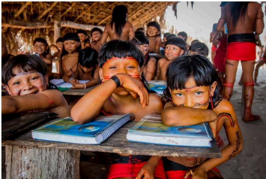
Imagem 2: O uso de materiais na prática pedagógica intercultural na Amazônia.

No campo da educação, a manutenção das línguas tradicionais exige a ruptura com os modelos pedagógicos monolíticos. A escola contextualizada na Amazônia, deve operar como centro de tradução e valorização, onde o léxico local é elevado ao status de conhecimento científico. A introdução de materiais didáticos que respeitam a fonética e a semântica de cada grupo são, portanto, a aplicação prática do ‘ato político de insubordinação’ descrito por Silva (2025), permitindo-se que, a sala de aula se transforme num espaço de reforço identitário em vez de apagamento.