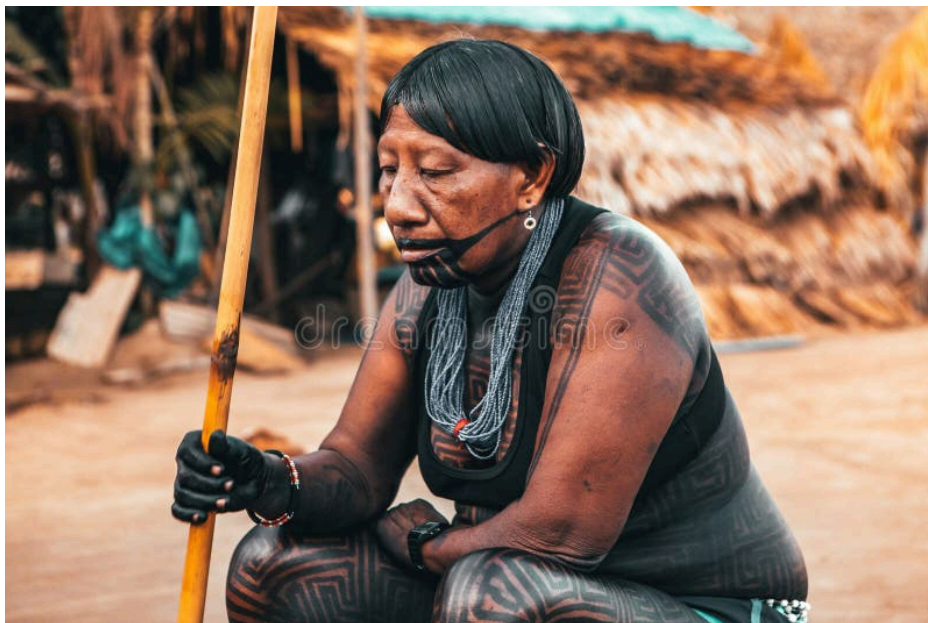
Imagem 3: A preservação da memória cultural.

Assim, a ancestralidade afro-indígena transcende a oralidade e materializa-se na cultura física - no traço do grafismo, na tecelagem e na farmacopeia tradicional. Esses objetos e práticas, não são apenas artesanato ou superstição; são 'documentos vivos' da memória coletiva que atualizam o passado no presente. Como defende Munanga (2015), a continuidade histórica do povo é tecida na repetição ritualística desses gestos técnicos e simbólicos, que servem como marcadores de identidade que se recusa a ser subalternizada.