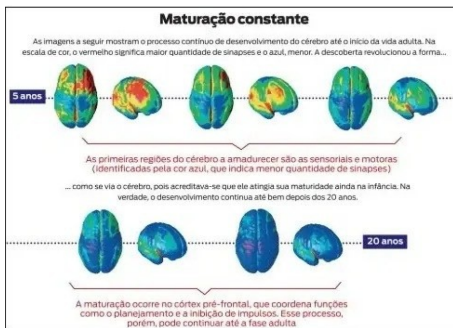
Figura 3- Desenvolvimento do córtex pré-frontal.

funções ainda estão em consolidação. Adolescentes não possuem plena maturidade cognitiva e socioemocional, o que impacta diretamente na tomada de decisões e no controle de impulsos.