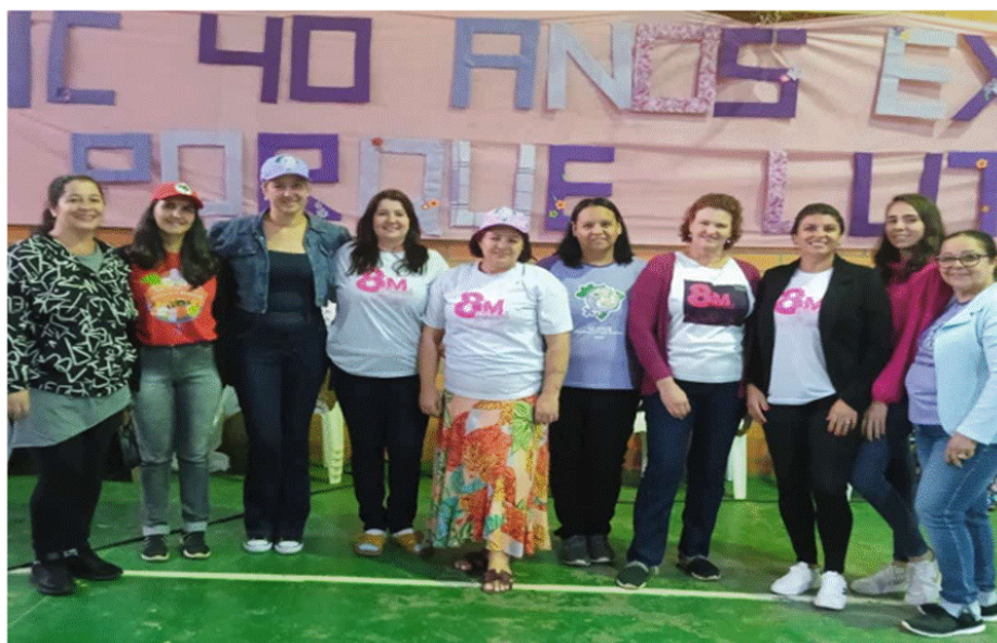
Figura 2 - Evento alusivo à comemoração dos 40 anos do Movimento de Mulheres Camponesas realizado em Chapecó/SC/Grupo de mulheres camponesas do Paraná

Na sequência, analisamos uma imagem de um encontro de formação trazido na dissertação “Reflexões sobre feminismo camponês e popular em interface com a agroecologia”: