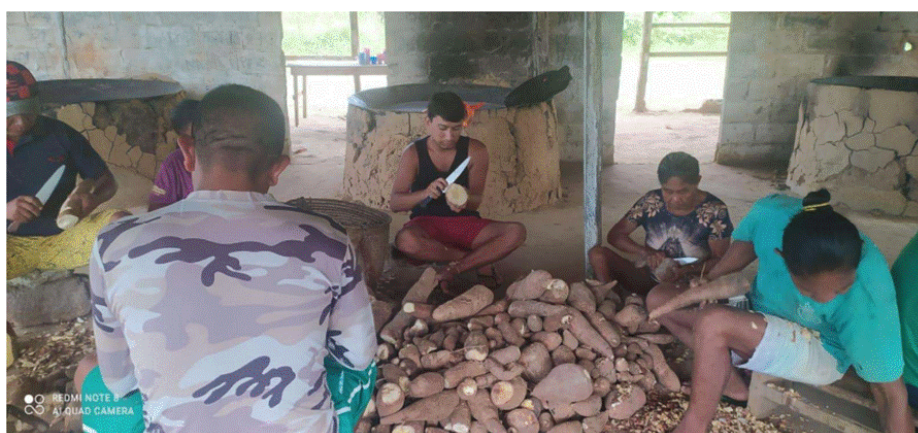
Figura 3 - Raspagem da mandioca

A seguir, nos debruçamos sobre a dissertação “Saberes ancestrais, alimentação e o processo de envelhecimento de mulheres indígenas do médio Rio Negro/Amazonas: contribuições para pensar as práticas agroecológicas, o bem-estar e a saúde”: