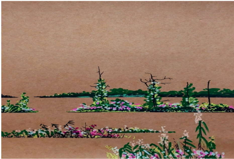
Figura 2 – Flávio Dutka, série Inverno Amazônico , 2025, marcador sobre papel, 20 × 30 cm.

Não há paisagem nas obras de Flávio Dutka. Nas séries Um lago chamado Cuniã e Inverno Amazônico (Figura 1 e 2 respectivamente), a pintura recusa a exterioridade do olhar que estrutura a tradição representacional ocidental, baseada na separação entre sujeito observador e território observado. Em lugar de um espaço organizado a partir de um ponto de vista estável, o que se apresenta é uma superfície instável, atravessada por campos cromáticos difusos e linhas que dissolvem a distinção entre figura e fundo.