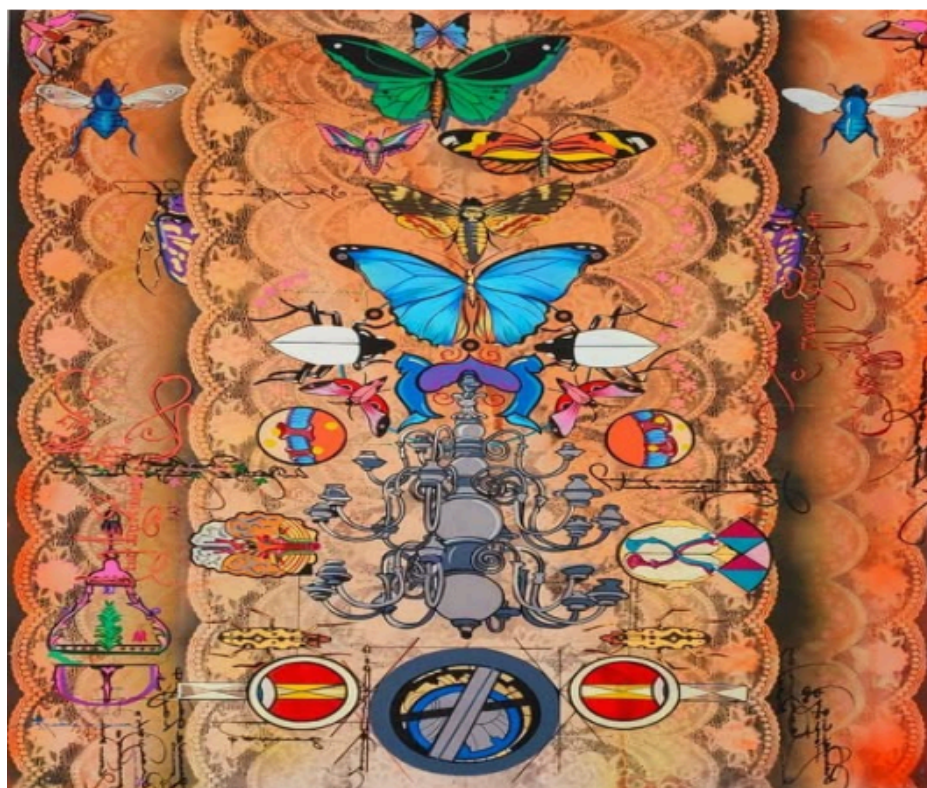
Figura 3 – Flávio Dutka, série Roc-oco , 2024, técnica mista sobre tela, 30 x 50 cm.