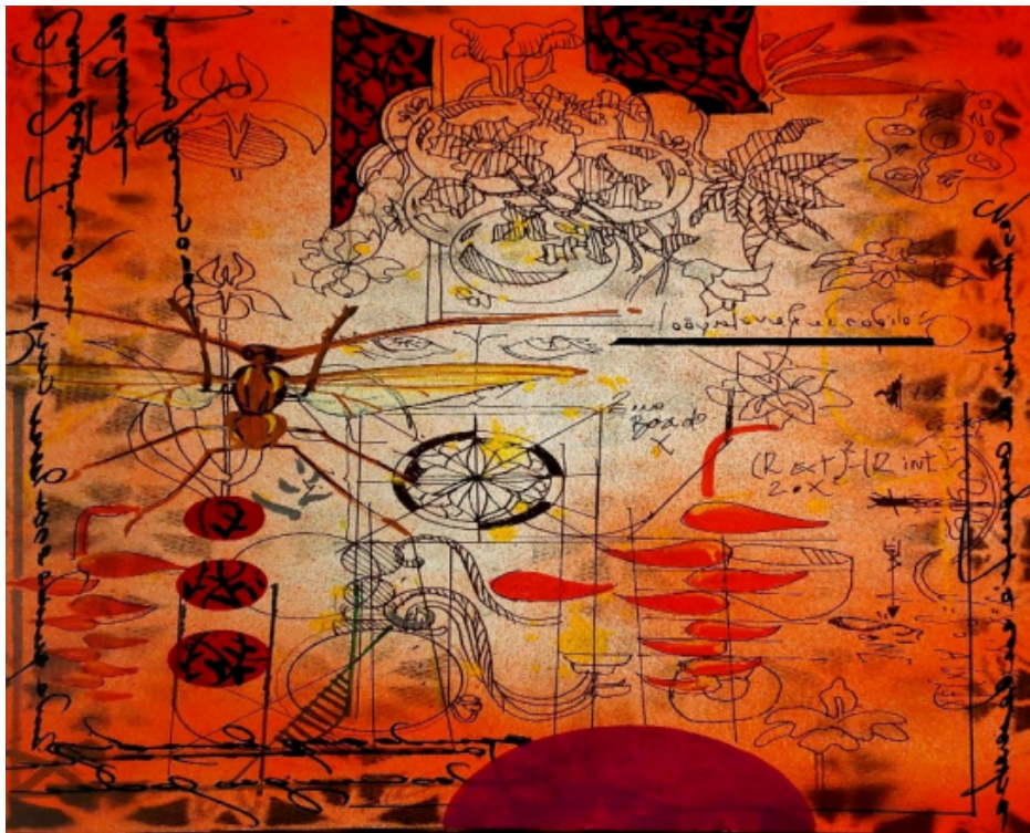
Figura 4 – Flávio Dutka, série Metamorphose , 2024, técnica mista sobre tela, 20 x 40 cm.

Se, nas séries anteriores, o envolvimento se manifesta como dissolução espacial, em Roc-oco e Metamorphose (Figuras 3 e 4), ele se intensifica como operação técnica. Nesses trabalhos, não é apenas o espaço pictórico que se desestabiliza, mas o próprio estatuto dos elementos que compõem a imagem, sobretudo aqueles historicamente associados à mediação entre sujeito e território, como instrumentos de orientação e formas de organização visual.