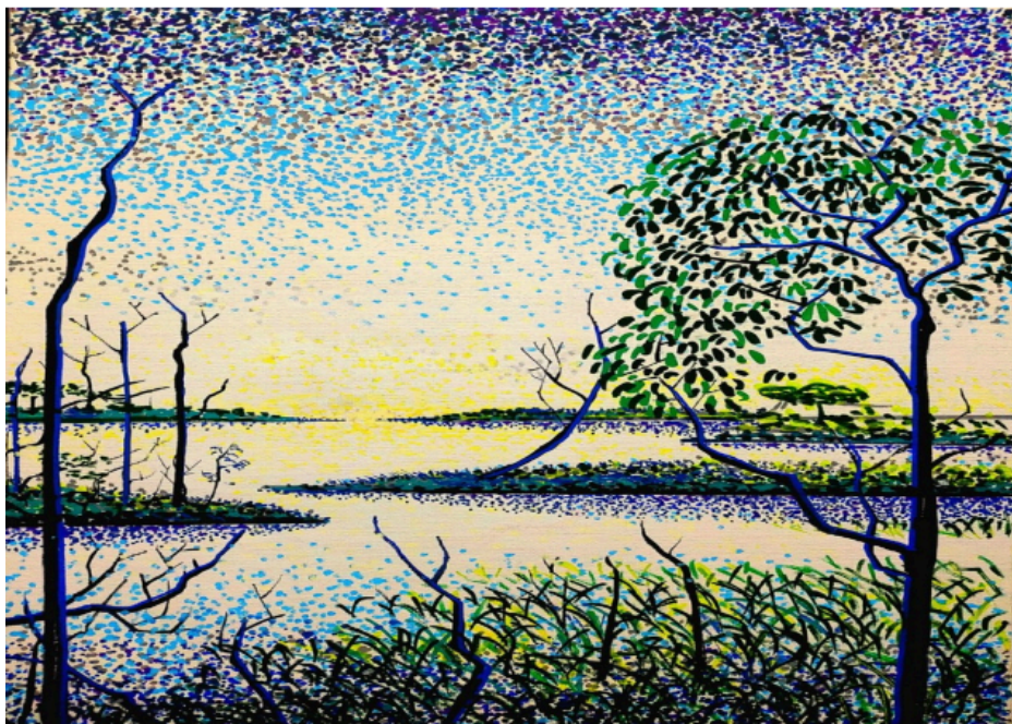
Figura 1 – Flávio Dutka, série Um lago chamado Cuniã , 2024, tinta acrílica e marcador sobre tela, 20 × 30 cm.