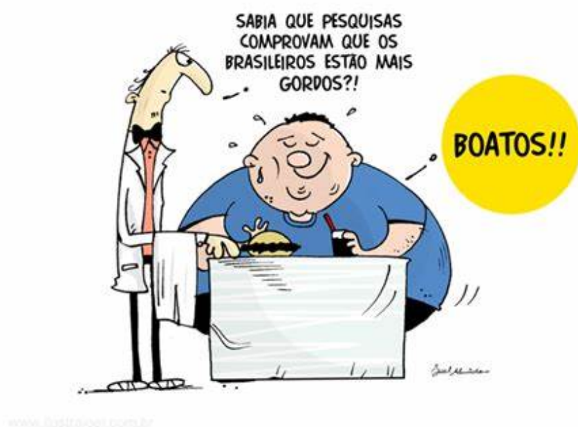
Imagem 3: Realidade social brasileira (b).

Nesse processo, os discursos midiáticos operam na construção de identidades mediante a regulação do saber sobre corpo, alma e vida, recorrendo a técnicas como a confissão exemplificada em reportagens e entrevistas.