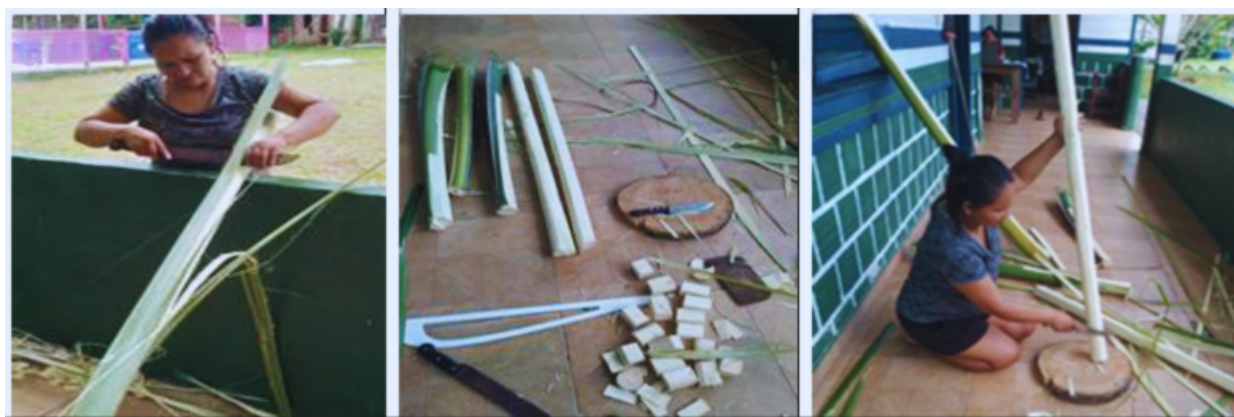
Figura 3 - Construção dos instrumentos didáticos indígenas