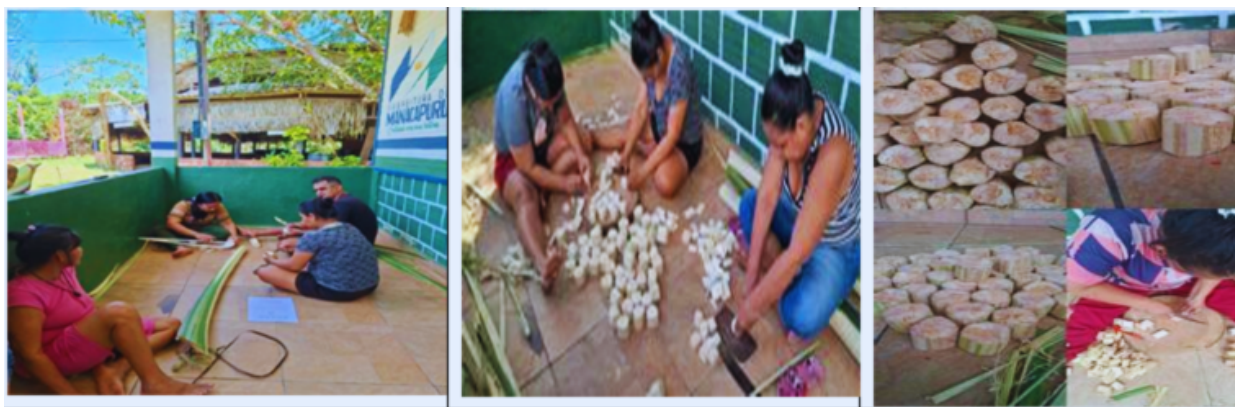
Figura 4 - Beneficiamento dos materiais naturais para uso pedagógico