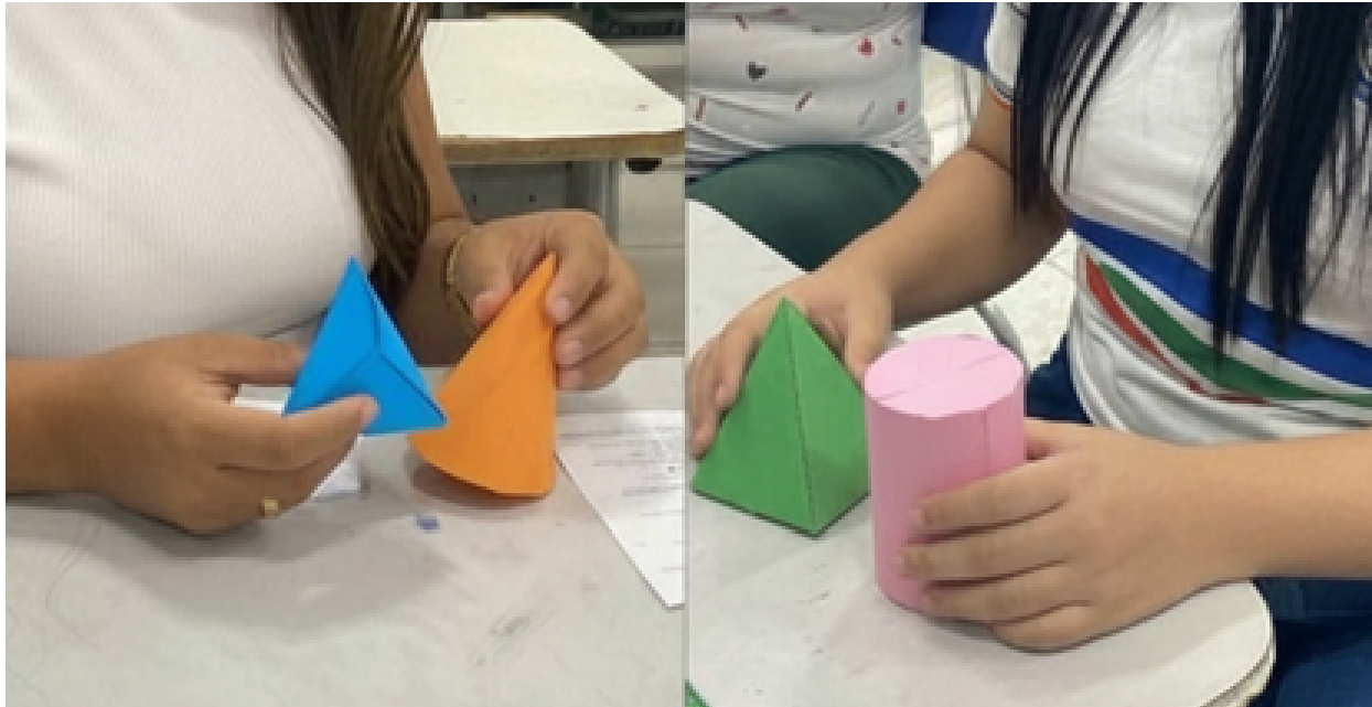
Figura 4: Aula de sólidos geométricos com construção de sólidos a partir de sua planificação.

Notou-se que o manuseio e a montagem das peças acionaram áreas específicas do encéfalo, como o córtex motor e o córtex somatossensorial. De acordo com a neurociência, quando o aprendizado envolve o tato e o movimento, criam-se múltiplas rotas de codificação da informação.