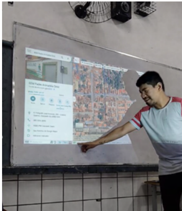
Figura 6: Aula expositiva sobre a aplicação do plano cartesiano através do uso do GPS.