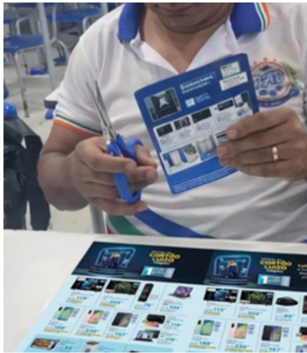
Figura 5: Aula de matemática financeira a partir de panfletos de loja.