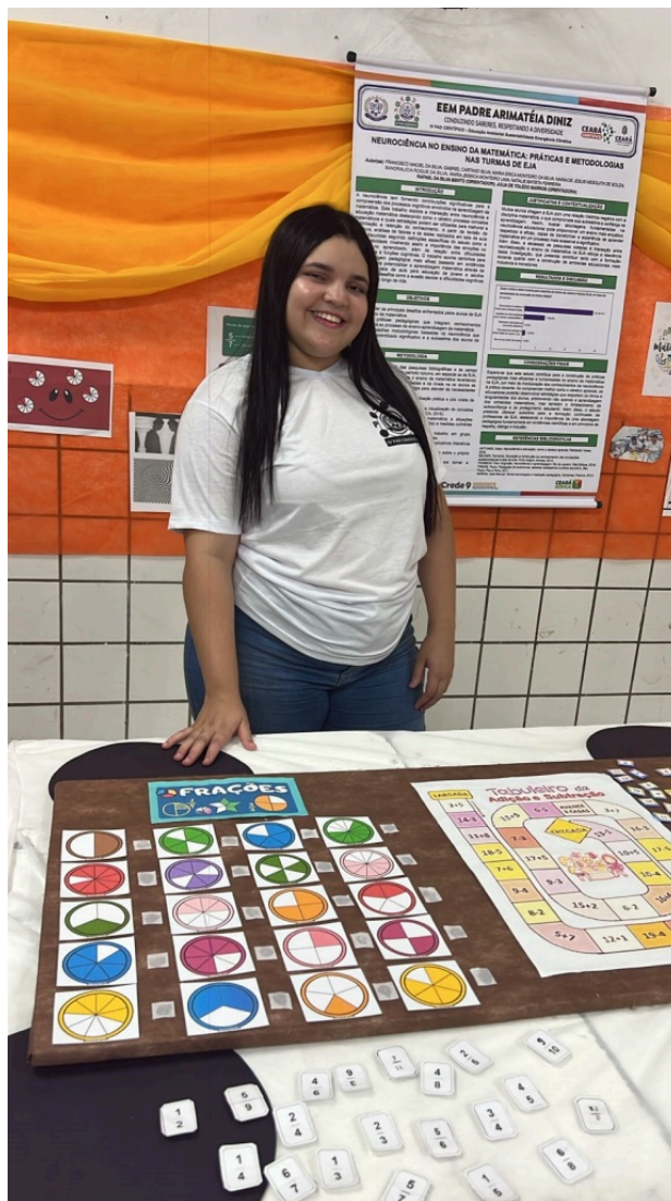
Figura 3: Registro da gamificação com uso de frações e operações básicas.