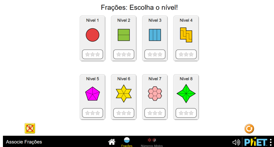
Figura 1: Simulador sobre montagem de funções e equivalência.

O uso do simulador PhET ajudou a superar o medo da abstração matemática, comum na EJA. Esse receio, conhecido como "ansiedade matemática", ativa a amígdala cerebral e prejudica o raciocínio lógico. A introdução da ferramenta mudou essa dinâmica, transformando o ensino passivo em uma aprendizagem por descoberta, onde o aluno aprende testando e observando resultados.