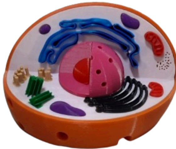
Figura 3 – Ilustração detalhada de uma célula animal.

A Figura 3 apresenta uma ilustração detalhada de uma célula animal, proporcionando uma representação visual das estruturas celulares discutidas no texto. Nessa imagem, é possível observar as principais organelas, como o núcleo, o retículo endoplasmático, as mitocôndrias e os lisossomos, bem como a membrana plasmática que envolve a célula. A inclusão dessa figura auxilia os leitores na visualização das complexidades celulares mencionadas, fornecendo uma representação tangível das estruturas celulares discutidas no parágrafo anterior.