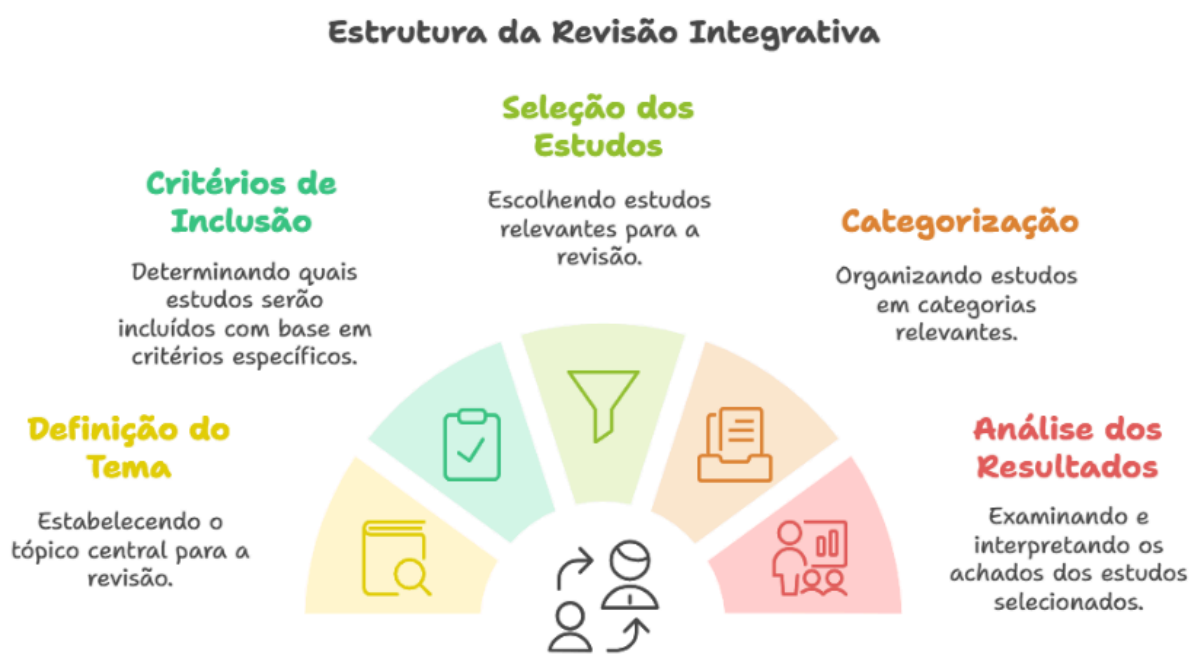
Figura 1 - Procedimentos Revisão Integrativa