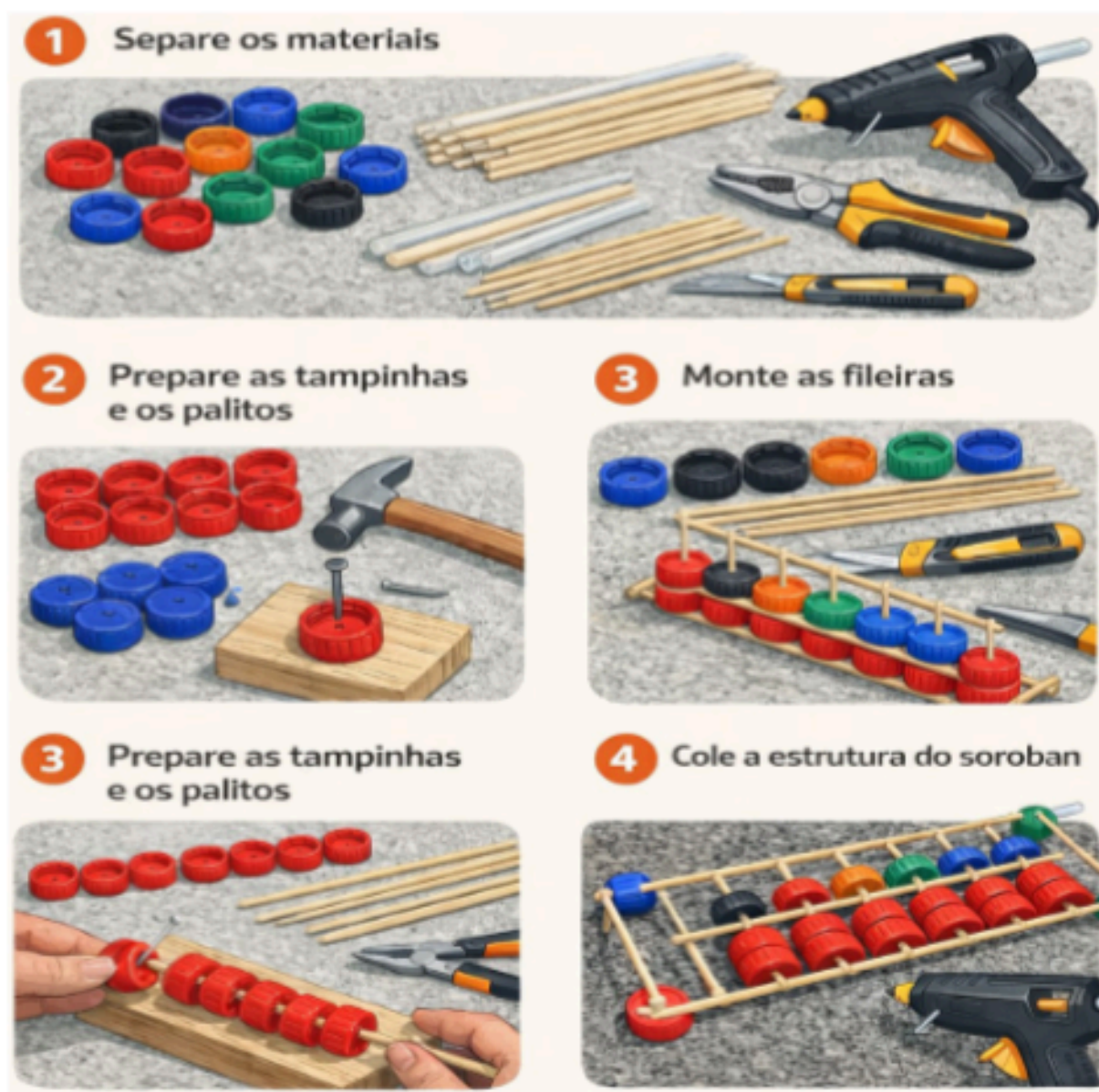
Figura 01 - Representação gráfica da confecção do Soroban com materiais recicláveis.

churrasco e tampinhas de garrafa PET, perfuradas com auxílio de prego e fixadas com cola-quente (Figura 01 e 02). A construção do instrumento possibilitou aos estudantes compreender sua estrutura e funcionamento, além de promover o engajamento ativo, o trabalho em equipe e a valorização de práticas sustentáveis. Ao confeccionarem o próprio material didático, os estudantes desenvolveram maior sentimento de pertencimento e responsabilidade em relação ao processo de aprendizagem.